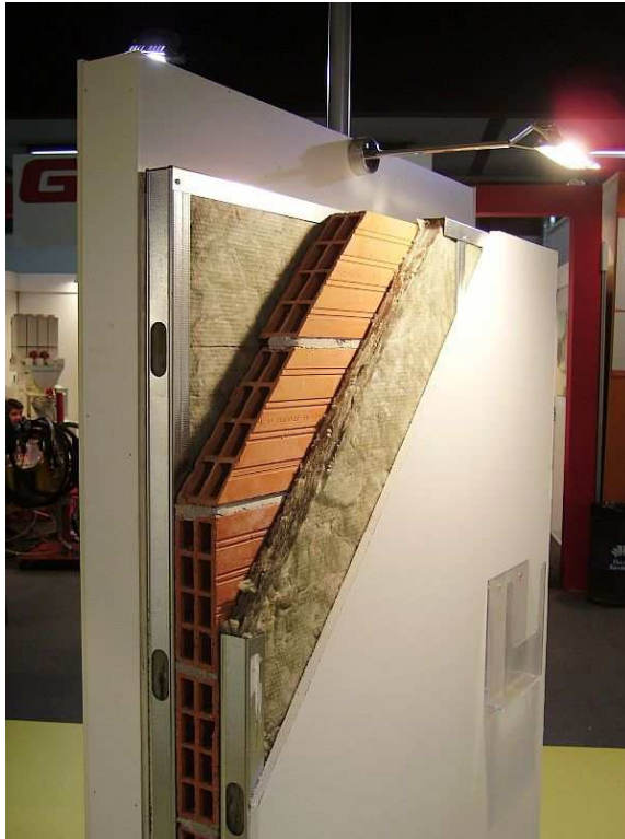
Foto 3. Sistema mixto de división entre vecinos.

Sin embargo, hay ayuntamientos que antes de la licencia de primera ocupación piden la verificación de los diferentes elementos constructivos. El caso más conocido es el del Ayuntamiento de Valencia, que ya lleva algunos años reclamándolo y la experiencia ha sido valorada muy positivamente.