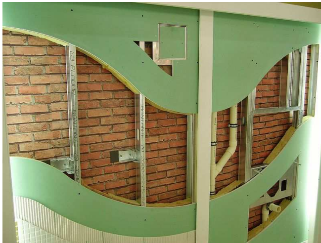
Foto 2. Sistema mixto cerámica y placas de yeso con paso de instalaciones.

Lo más probable es que la opción favorita de los proyectistas sea el método simplificado. Son soluciones que determinan el grado de aislamiento a través de una serie de medidas en construcciones reales. Estas soluciones están sobredimensionadas y aseguran estar por encima de los índices del DB-HR, siempre y cuando la ejecución sea la correcta.