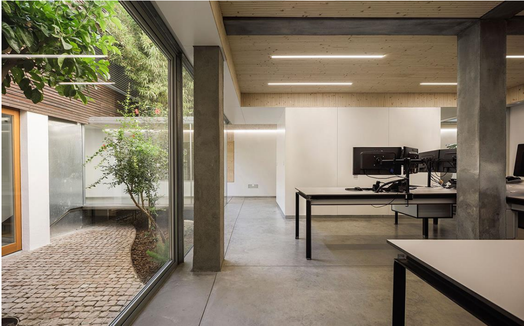
Oficina en el interior de una manzana, por Sol89.

Inscríbete aquí para asistir al Congreso