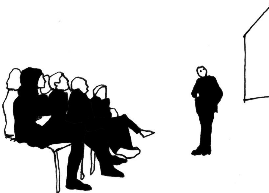
Ilustración © Anna Bach.

Congreso de la XV Bienal Española de Arquitectura y Urbanismo