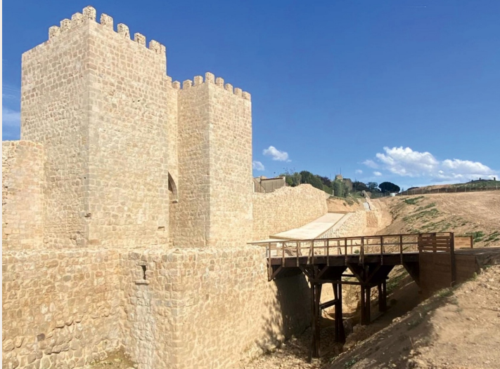
Comparativo antes y después puerta Mercado murallas Almazán.