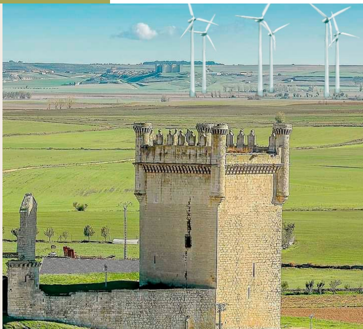
Fotomontaje impacto aerogeneradores entre los castillos de Belmonte y Montealegre.